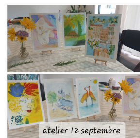
atelier 12 septembre